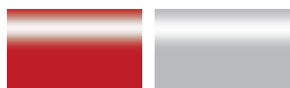
Rojo eléctrico Gris metalizado